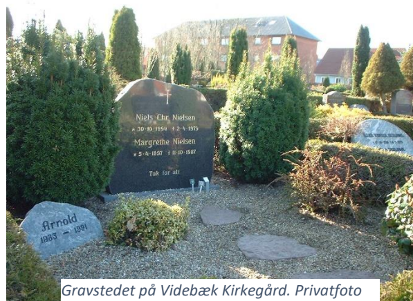
Gravstedet på Videbæk Kirkegård.

I dette lille "mindeskrift" vil jeg fokusere på en af hans store passioner, som var Esbjerg forenede Boldklubber (Efb). Han fulgte klubben tæt, og blev en kendt figur på stadion, når Efb spillede.