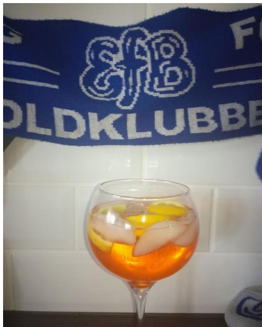
Mindfoto til Arnold fra Facebook gruppen: "EfB Før og Nu"