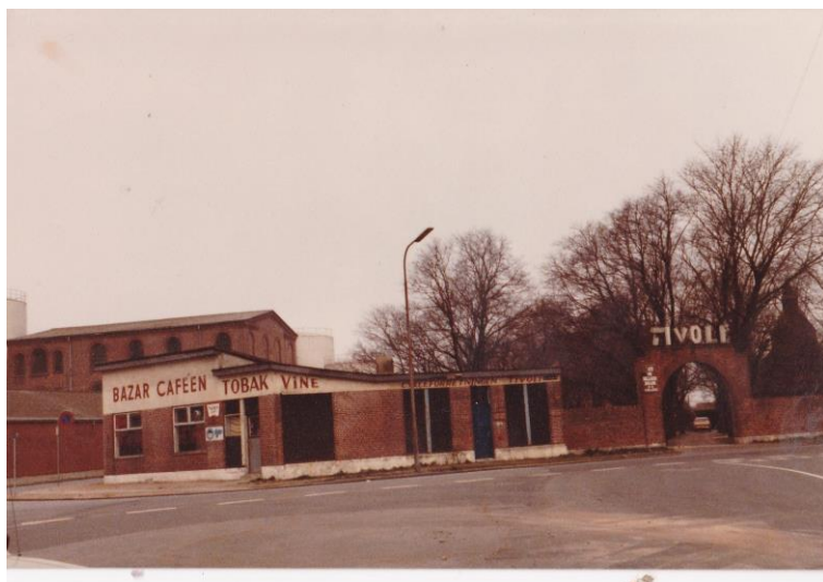
Tivoli og "Æ Gangster" (Bazar).